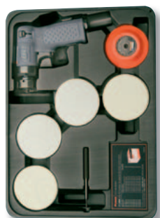
Kit 3128K (CPN: 80195613)