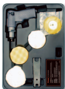
Kit 3129K (CPN: 80195605)