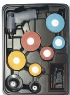
Kit 3103K (CPN: 80195597)